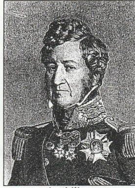
Louis Philippe Ier