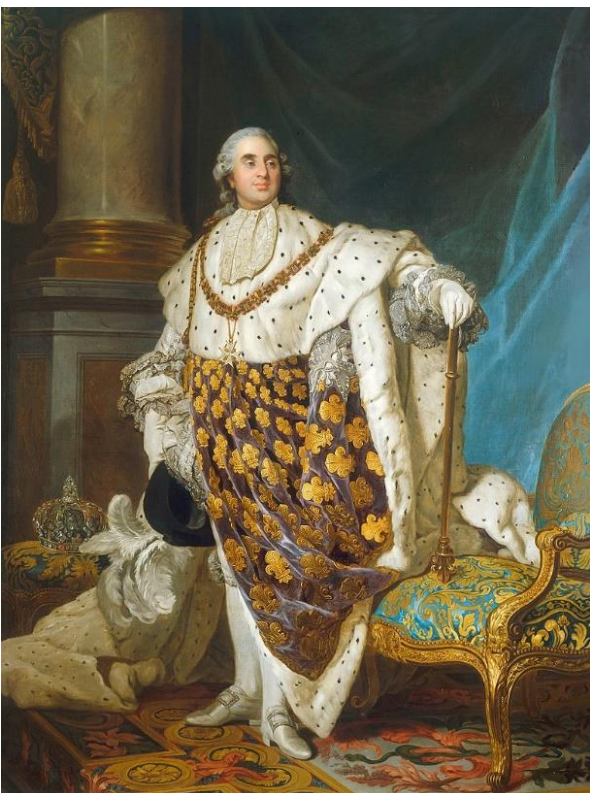
Louis XVI en costume de sacre